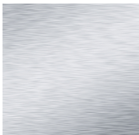
Satinized/Satinato steel satinized